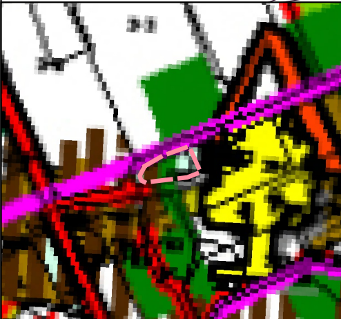
Granice opracowania Wyrys ze Studium SKALA 1:5000